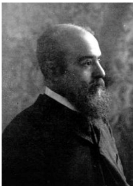
วิลเฟรโด พาเรโต (Vilfredo Pareto)

ผ่านไป 1 ปี ปราชญ์ชวนศิษย์ไปรด กลับไปเยือนบ้านหลังเดิม ทว่าหลังจากค้นหาค้นหาอยู่นาน กลับไม่พบกระท่อมพุงหลังเดิม แต่เป็นบ้านหลังใหม่ที่ดูดีกว่าขึ้นมาแทนที่ในตำแหน่งเดิม